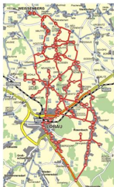
Beispiel eines Bedienungsgebietes mit RF-Bus

Anrufbus Kittlitz bei Löbau (ZVON-Gebiet) verkehrt